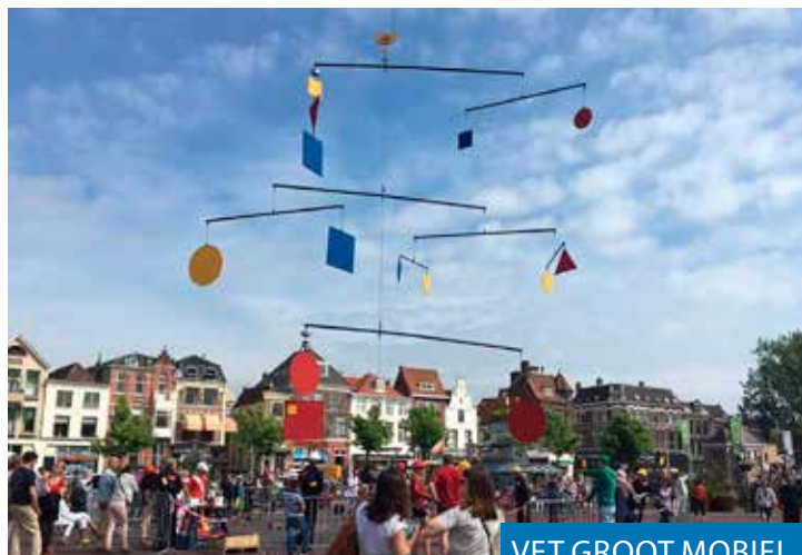
VET GROOT MOBIEL