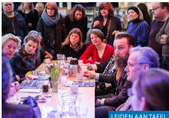
LEIDEN AAN TAFEL