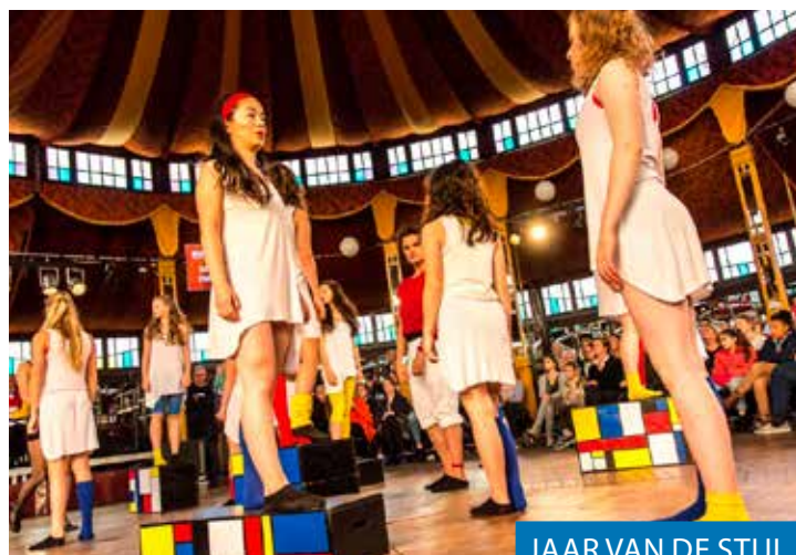
JAAR VAN DE STIJL