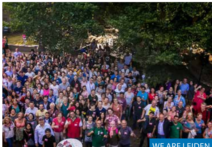
WE ARE LEIDEN