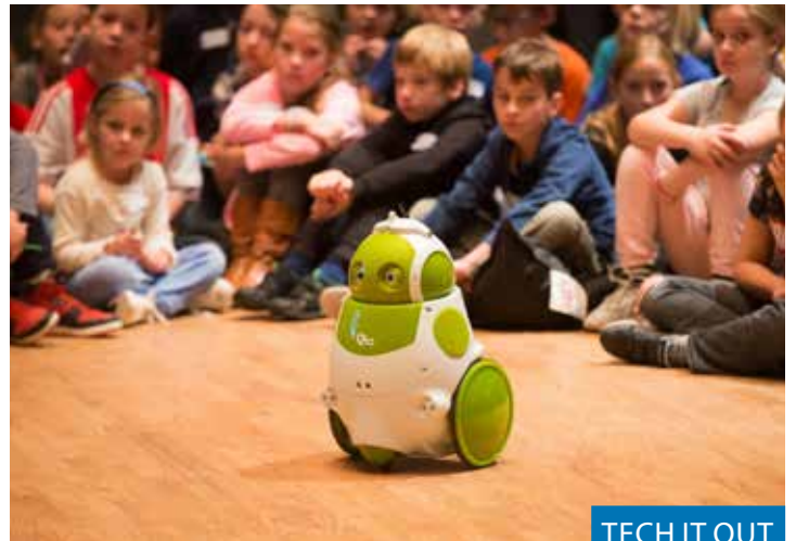
TECH IT OUT