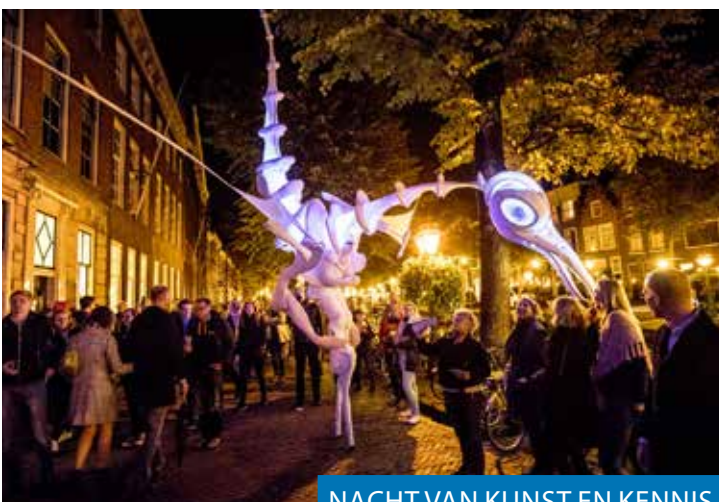
NACHT VAN KUNST EN KENNIS